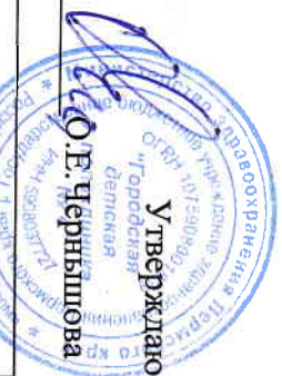
График рабочего времени сотрудников ДШОН № 2 ГБУЗ ПК ГДЦ № 4 на 2016 год