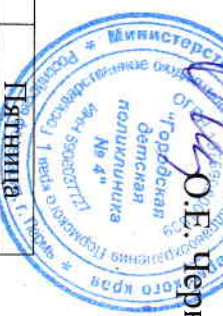
График работы сотрудников центра здоровья на 2017г