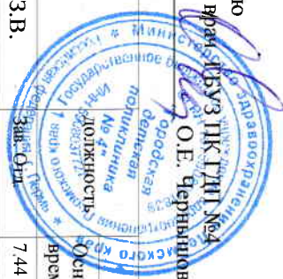
График рабочего времени ФТО на 2017 год.

Утверждаю Главный врач ИБУЗ ПК ГДП №4 О.Е. Чернышова