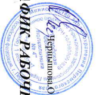
ГРАФИК РАБОЧЕГО ВРЕМЕНИ СОТРУДНИКОВ ПОЛИКЛИНИКИ №4 НА 2017 год

Утверждено Главный врач ГБУЗ ПК ГДП № 4 Чернышова О.Е.